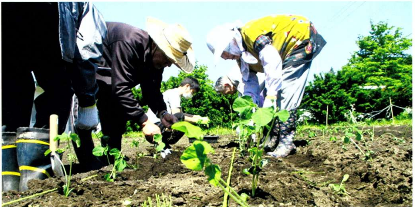
長生園…5月に入所者の皆様が、園内の畑で枝豆を植えている様子