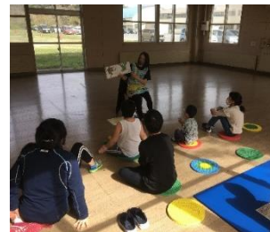
長期休業中の活動