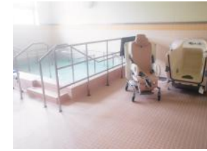
デイサービス浴室