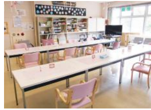
デイサービスルーム

長生園は、三八地域で唯一の養護老人ホームで、敷地内に畑や樹木を有し周囲を緑に囲まれた自然豊かな環境にあります。概ね65歳以上の経済的に困窮している高齢者で、身体的、精神的、家庭環境などの理由により、自宅で生活することが困難であり、身の周りのことがある程度ご自分でできる方を受け入れる施設です。