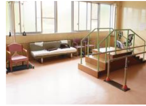
デイサービス機能訓練室